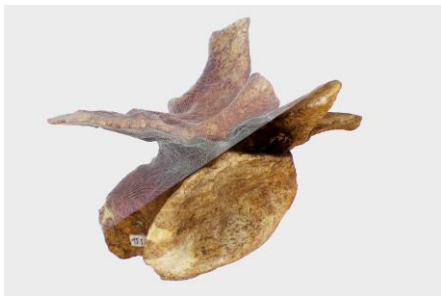
Scan eines deformierten Wirbels