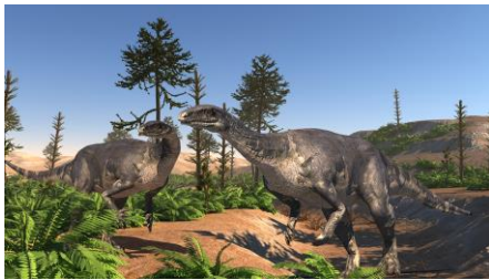
Zwei Plateosaurier in der trockenen Landschaft der Trias