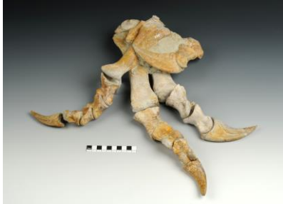
Fuß des Plateosaurus